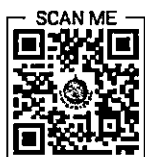
QR Code ๓