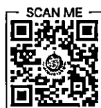
QR Code ๔